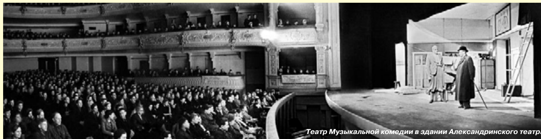
Театр Музыкальной комедии в здании Александринского театра

В репертуаре Театра Музкомедии сверхпопулярной ста-