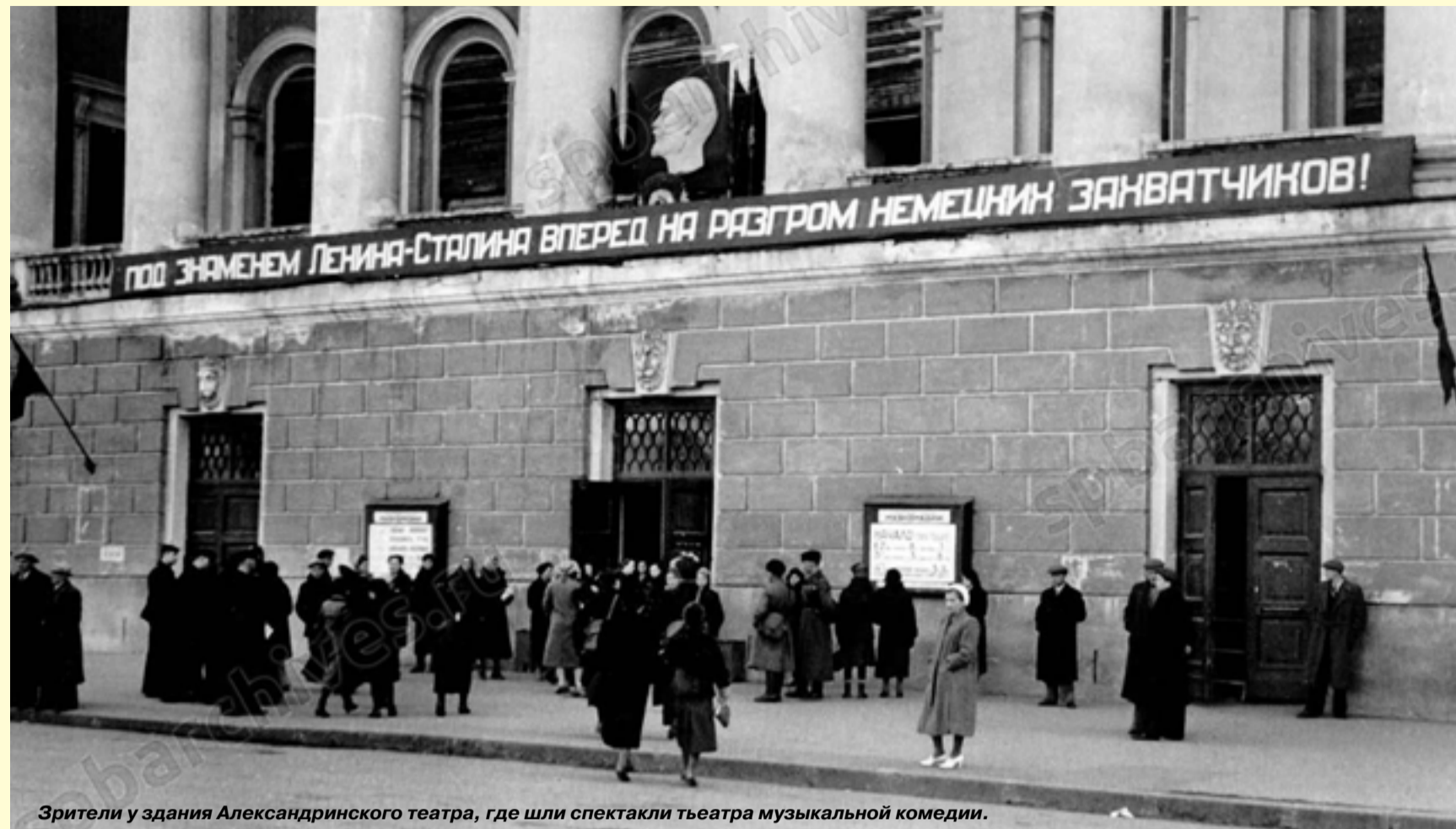
Зрители у здания Александринского театра, где шли спектакли тьетра музыкальной комедии.